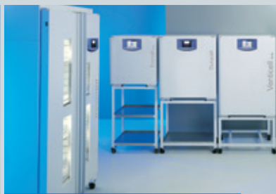
Laboratorní sušárny a inkubátory 22–1212l