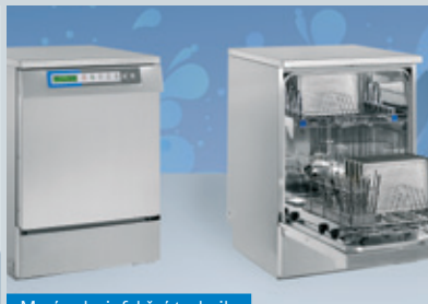
Mycí a dezinfekční technika