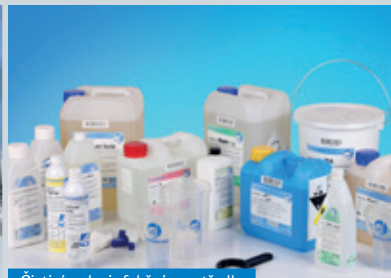
Čistící a dezinfekční prostředky