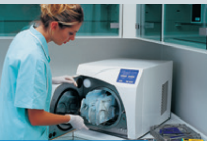
Malé parní sterilizátory 15–25l