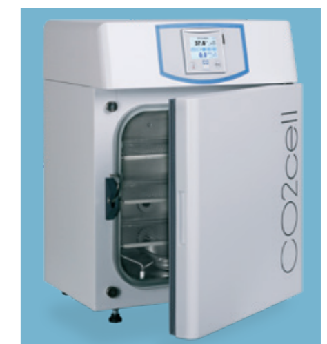
CO2cell 50 Standard