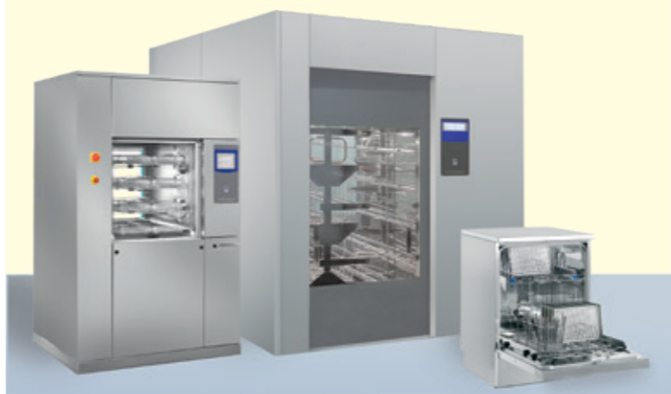
MYCÍ A DEZINFEKČNÍ AUTOMATY