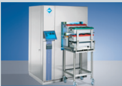
Parní sterilizátory 140–1490l