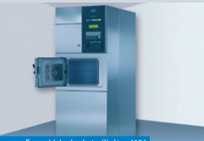
Formaldehýdový sterilizátor 110l