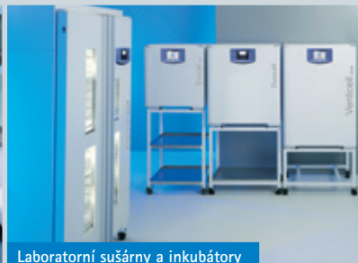
Laboratorní sušárny a inkubátory