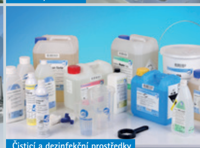
Čističí a dezinfekční prostředky