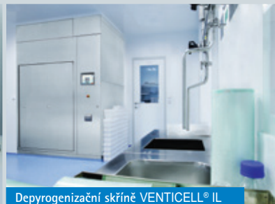
Depyrogenizační skříně VENTICELL® IL