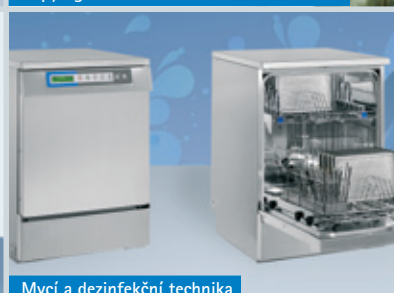
Mycí a dezinfekční technika