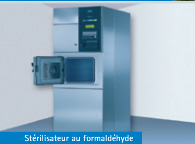
Stérilisateur au formaldéhyde