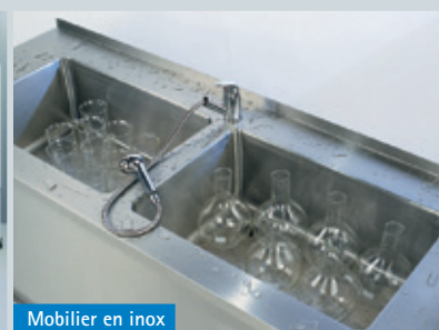
Mobilier en inox