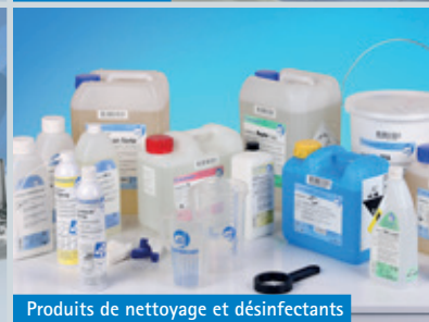
Produits de nettoyage et désinfectants