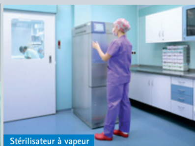
Stérilisateur à vapeur