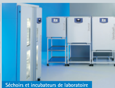
Séchoirs et incubateurs de laboratoire