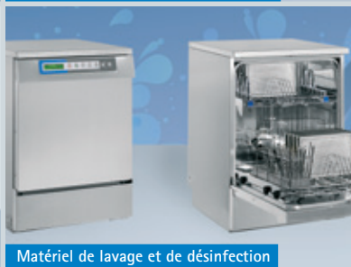
Matériel de lavage et de désinfection