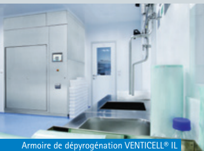
Armoire de dépyrogénéation VENTICELL® IL