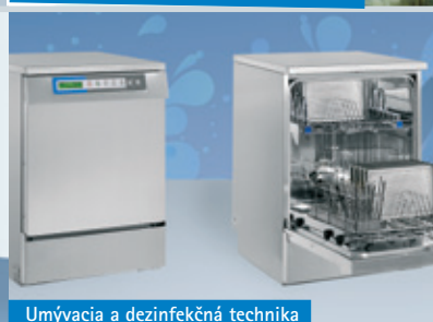
Umývací a dezinfekčná technika