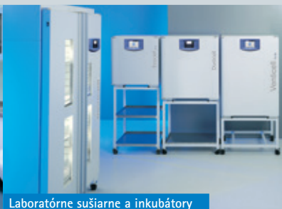
Laboratórne sušiarne a inkubátory