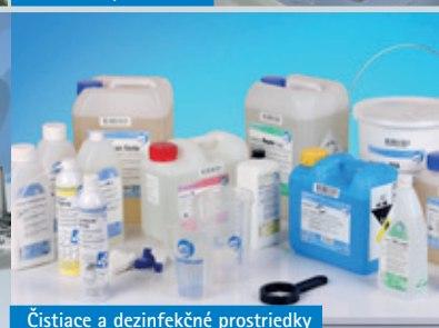
Čistiace a dezinfekčné prostriedky