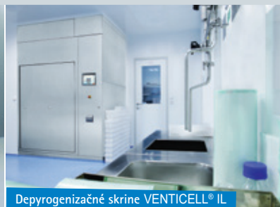
Depyrogenizačné skrine VENTICELL® IL